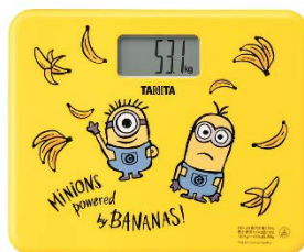
「デジタルヘルスマーター（ミニオン）」

計測・表示項目は「体重」のみ。大きさは奥行200mm、幅244mm、高さ33mm、重さは約740g（電池含む）。収納や持ち運びに便利なB5サイズに近い大きさとなっています。