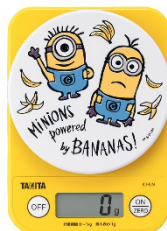
「デジタルクッキングスケール（ミニオン）」

計量範囲は0から1kgまで、最小表示は1gのシンプルで使いやすい調理用はかりとなっています。大きさは奥行154mm、幅110mm、高さ30mmで、重さは約211g（電池含む）。