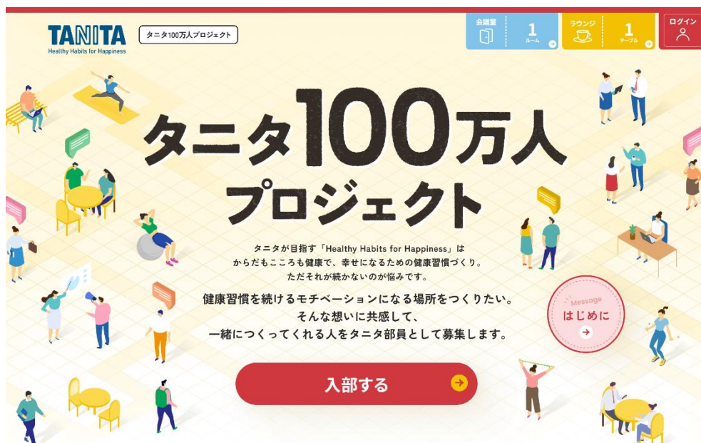
タニタ公式コミュニティサイト「タニタ100万人プロジェクト」

健康総合企業の株式会社タニタ（東京都板橋区前野町1-14-2、社長・谷田千里）は、生活者とともに“健康をつくる”「タニタ100万人プロジェクト」を本日5月9日よりスタートします。本プロジェクトは、多世代の生活者とタニタ社員が、健康に関する情報共有や意見交換を通じて健康づくりの輪を広げることで、「生活者の健康をつくり、そして自身も健康になれる」ことを目的としています。これを実現するため、交流と発信のフィールドとなる同名の公式コミュニティサイトを開設。同日より参加者募集を開始します。本サイトの特徴は、生活者とタニタ社員が一緒になって、健康づくりのコンテンツを企画からつくり上げていく共創型のプラットフォームであることです。健康に関する知識や経験を持つ人だけでなく、ダイエットや健康習慣が続かない人、ウェブサイトのコンテンツづくりに詳しい人など、異なる立場のさまざまな経験や意見を持つ多彩な人々が集い、健康づくりにおける新たな価値を共創。“100万人との交流”をスローガンに、参加者一人ひとりが本プロジェクトの活動を支えています。