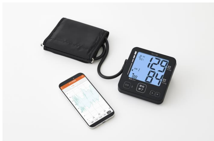
上腕式血圧計 BP-228L（上）と スマホアプリ「ヘルスプラネット」での血圧グラフィイメージ

2人分の測定結果（測定日時、最高血圧、最低血圧、脈拍数）を過去100回分まで本体に記録します。また手首式血圧計 BP-218L と上腕式血圧計 BP-228L はスマートフォンアプリ「ヘルスプラネット」と連携が可能。通信機能を備えたタニタの体組成計や活動量計ではかった体重や体脂肪率、活動量などの計測データと合わせて一元管理することができます。