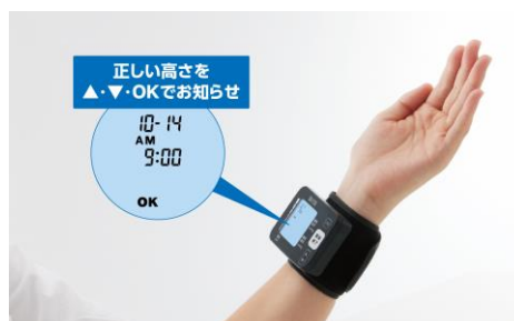
姿勢サポート機能の表示画面イメージ

手首式血圧計ではかる際には、機器を装着した手首の高さによって血圧が大きく変化する恐れがあるため、姿勢サポート機能を備えました。画面の指示に合わせて手首の高さを調整することで適切な測定姿勢をサポートします。旅行や出張先に持っていくやすい収納ケースも付属します。