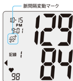
脈間隔変動マークが点灯した画面イメージ

測定中に動いてしまったり正しく装着できていなかったりするなど、脈間隔の変動を感知した場合には、測定結果画面に脈間隔変動マークが点灯して知らせます。脈間隔変動マークが点灯した場合は再測定を推奨します。