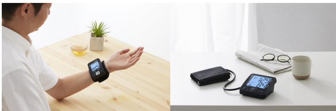
左から手首式血圧計 BP-215、上腕式血圧計 BP-228L

健康総合企業の株式会社タニタ（東京都板橋区、代表取締役社長・谷田千里）は、インテリアになじみやすいダークカラーの血圧計を 11 月 1 日に発売します。発売するのは手首で手軽にはかることができる手首式血圧計の BP-215 と BP-218L、上腕へカフを巻き付けてはかる上腕式血圧計の BP-225 と BP-228L の全 4 種。BP-218L と BP-228L は Bluetooth®※1 通信に対応しており、スマートフォンアプリ「ヘルスプラネット」で測定データを記録・確認できます。起床後や就寝前に測定する人が多いことから、寝室に置いても違和感の少ないダークブルーのカラーを採用しました。また緩やかに腕を加圧する昇圧測定方式を採用することで腕への過剰な加圧を抑え、測定者の負担を少なくしました。価格はいずれもオープン。家電量販店などを中心に販売し、4 機種合計で初年度 2 万台の販売を計画しています。