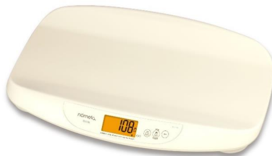
授乳量機能付ベビースケール「nometa（のめた）」BB-115L

「育児管理画面」で育児の各項目とともに授乳した時間や量を表示（左）、 授乳量を日ごとに一週間表示したグラフ（中央）、成長曲線