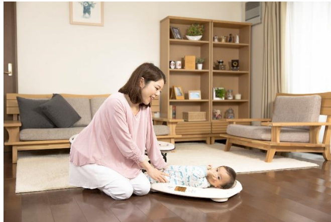
授乳量機能付ベビースケール「nometa（のめた）」BB-115L ではかる様子