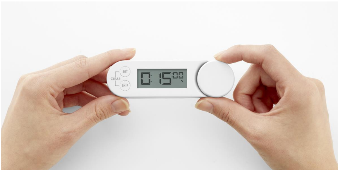
学習タイマー「TD-433」(ホワイト)

健康総合企業の株式会社タニタ（東京都板橋区、代表取締役社長・谷田千里）は、5つの異なるタイマーを設定できる「プリセットタイマー機能」をはじめ、計画に沿った効率的な学習をサポートする4つの機能を搭載した学習タイマー「TD-433」を3月4日に発売します。価格はオープンで、カラーはホワイトとブラックの2種類。受験勉強に励む中高生をターゲットにタニタオンラインショップ（ https://shop.tanita.co.jp/ ）とインターネット通販サイト「Amazon」で販売します。